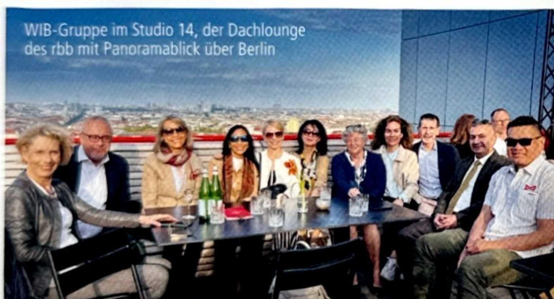
WIB-Gruppe im Studio 14, der Dachlounge des rbb mit Panoramablick über Berlin

Im Mai 2023 konnten die Mitglieder von Willkommen in Berlin einen Blick hinter die Kulissen des Rundfunk Berlin-Brandenburg (rbb) werfen. Wie entsteht eine TV-Nachrichtensendung? Woher kommt die Musik im Radio? Diese und viele Fragen mehr wurden bei einer interessanten 90-minütigen