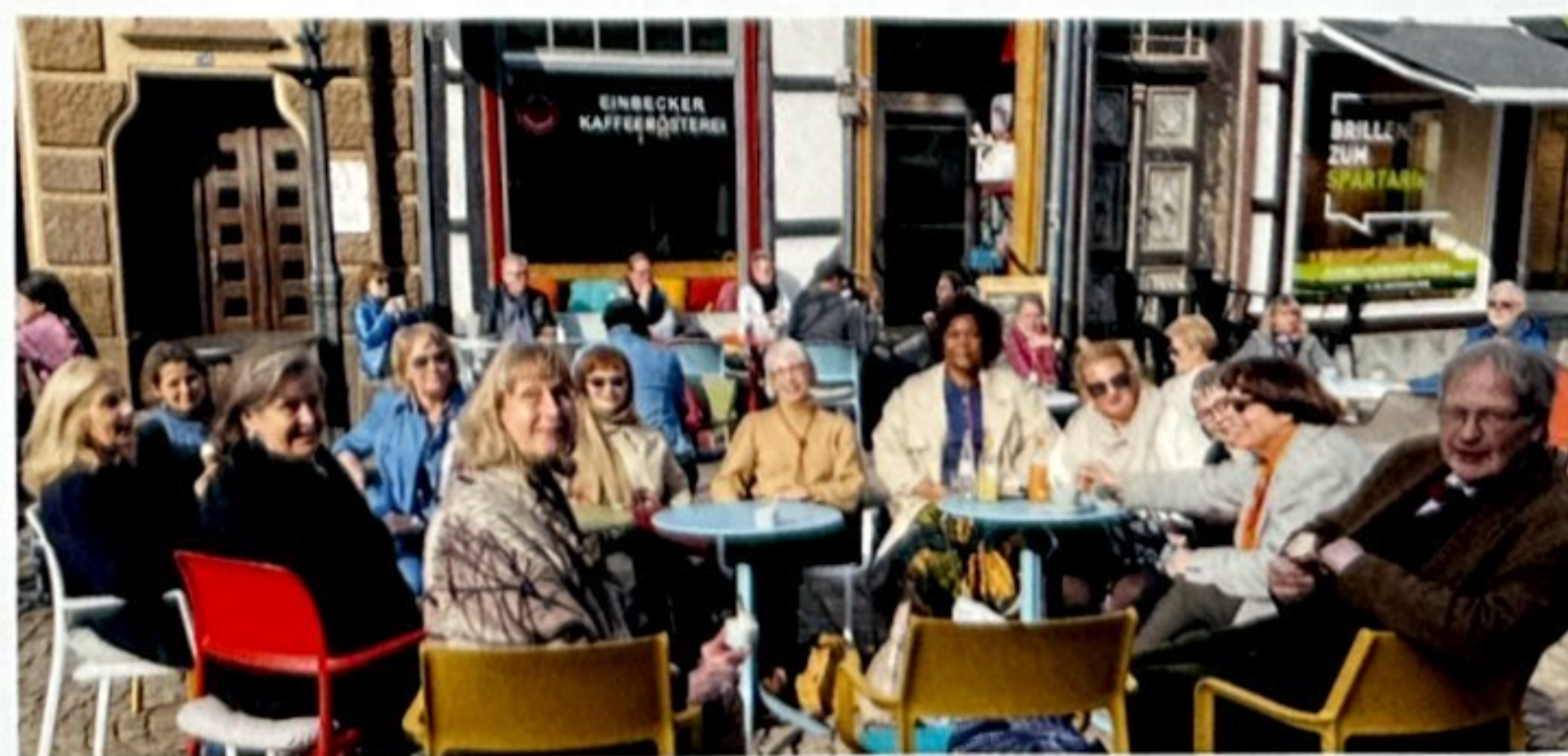
▲ Sightseeing-Pause in Einbeck

führung und Mittagessen bei der Firma KWS Saat SE - weltweit viertgrößter Hersteller von Saatgut landwirtschaftlicher Nutzpflanzen - bildete den Abschluss der Reise, bevor ein Oldtimer-Bus die WIB-Gruppe zum Bahnhof Einbeck brachte.